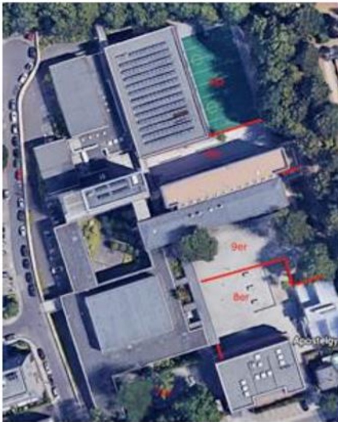
Schulhofbereiche der Sekundarstufe I

Auf den gesamten Pausenhof wird ein Mund- Nasenschutz getragen. Kontakt- und Ballspiele sind auf dem Pausenhof verboten. Die Sekundarstufe II hat keine fest zugeordneten Schulhofbereiche, ist aber verpflichtet, auf dem Pausenhof den Abstand von 1,50 Metern zu anderen Jahrgangsstufen zu halten.